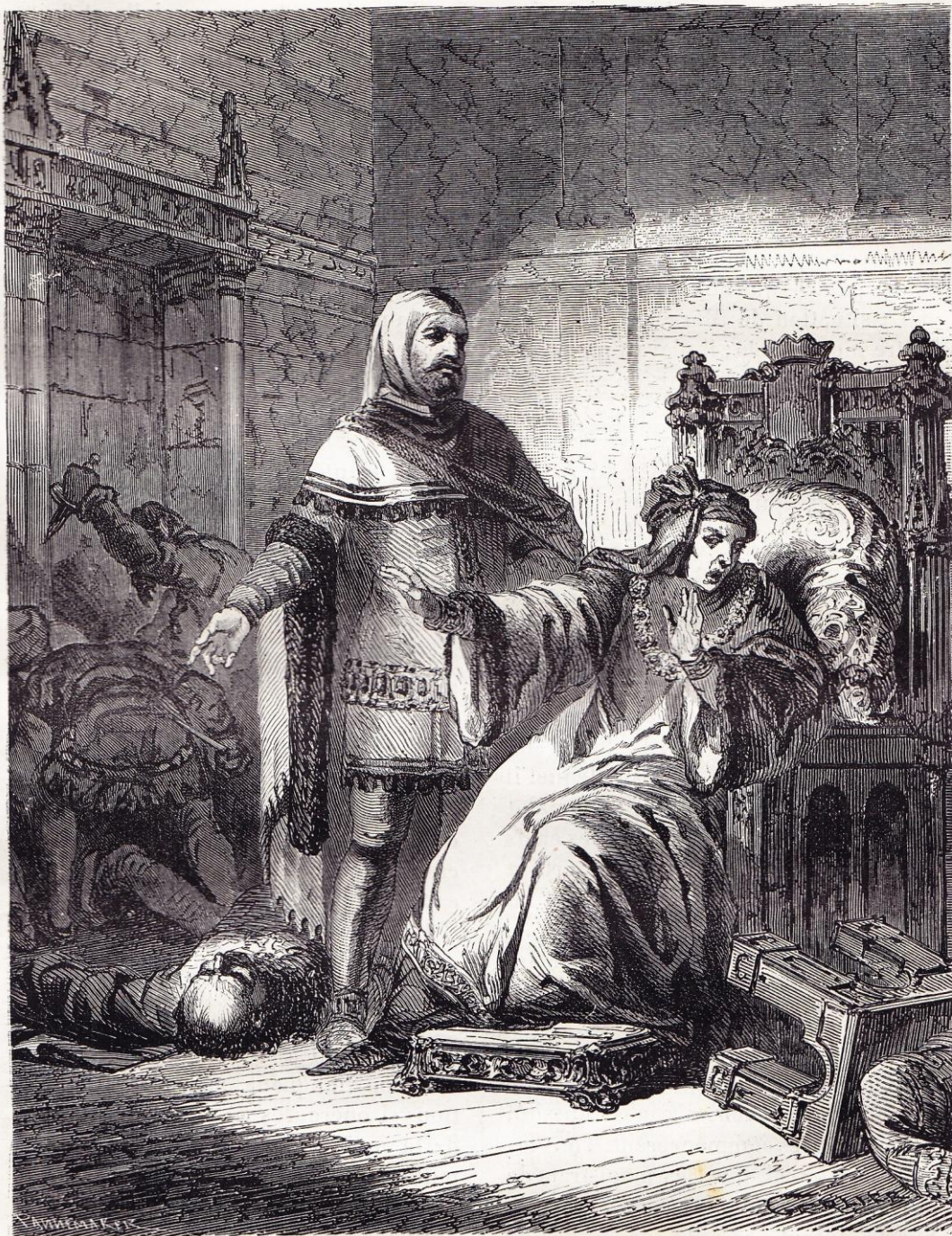
Marcel et le dauphin (23 février 1358).

fut une trahison... Sommé de marcher contre le dauphin qui s'avancait du côté de Charenton et de Saint-Maur, il